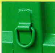
6 attaches intérieures