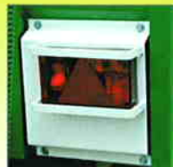
Feux arrière protégés