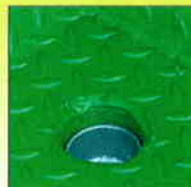
4 bouchons de vidange