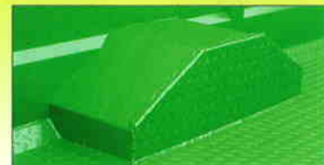
Passages des roues chanfreinés